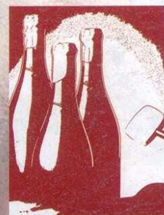
DOSSIER SPÉCIAL MAÎTRES D'HÔTEL ET SOMMELIERS